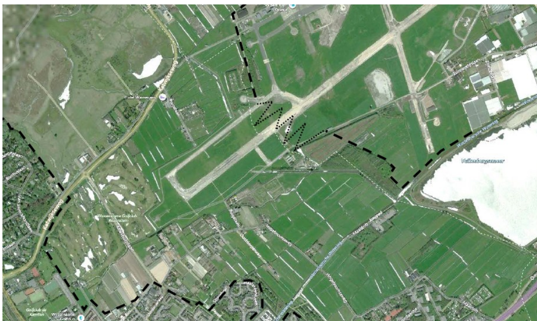
Indicatieve toekomstige begrenzing Groene Buffer